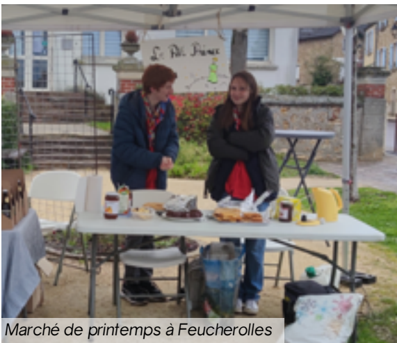
Marché de printemps à Feucherolles

Pour les Pionniers/Caravelles c'est aussi la période des «extra-jobs» pour financer leur camp d'été en Croatie (cela peut être du baby sitting , du jardinage ,animation, .. ).