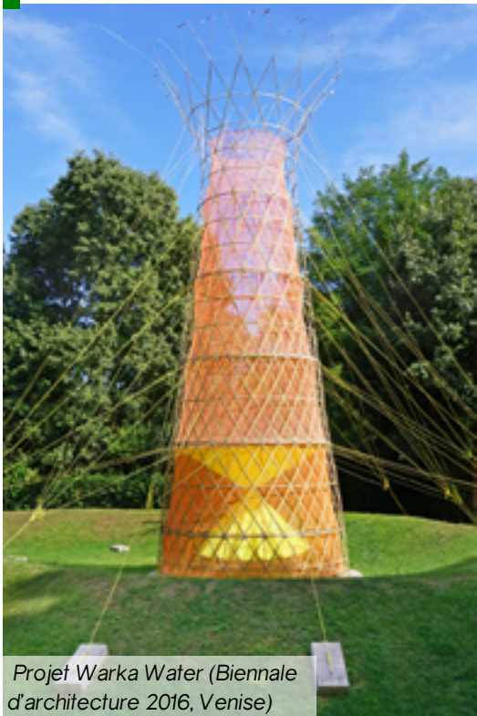
Projet Warka Water (Biennale d'architecture 2016, Venise)