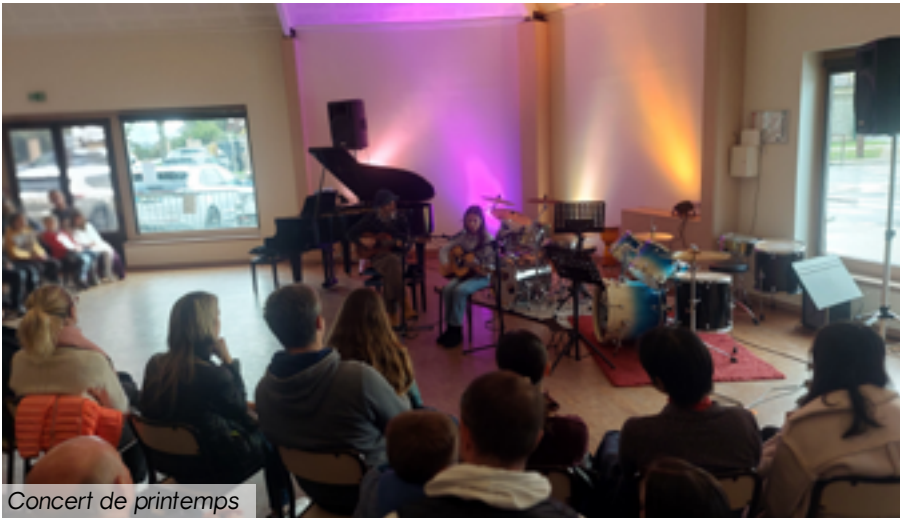
Concert de printemps