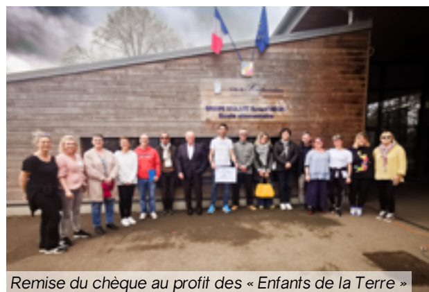
Remise du chèque au profit des « Enfants de la Terre »