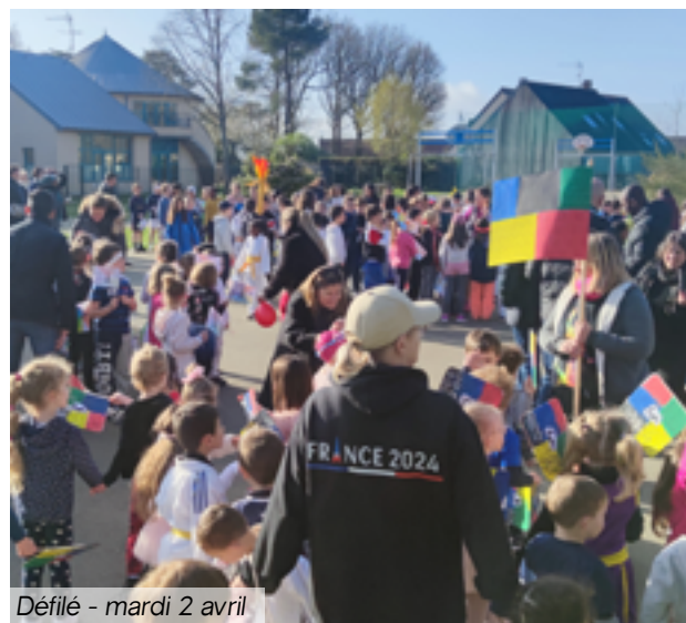
Défilé - mardi 2 avril