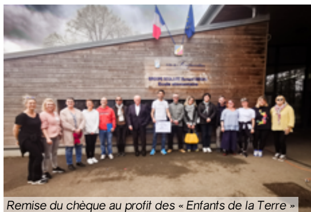
Remise du chèque au profit des « Enfants de la Terre »