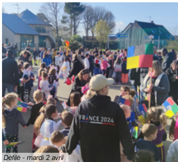
Défilé - mardi 2 avril