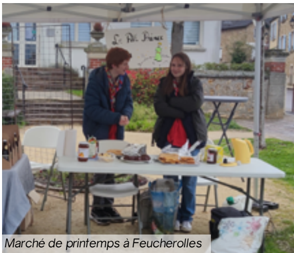
Marché de printemps à Feucherolles

Pour les Pionniers/Caravelles c'est aussi la période des «extra-jobs» pour financer leur camp d'été en Croatie (cela peut être du baby sitting , du jardinage ,animation, .. ).